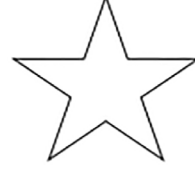
தேவனுடைய இராஜ்ஜியத்தை இறுதி வடிவில் ஸ்தாபித்தல்.

விரிவாக்கம் செய்யப்பட்டது —> மனிதனால் —> இஸ்ரவேலரால் —> சபையால்