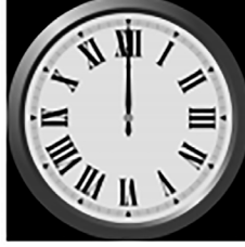
இறுதி வேளையில் திரும்பி வரும் இராஜா