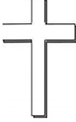
பூமியிலிருக்கும் தேவனுடைய இராஜ்ஜியம்